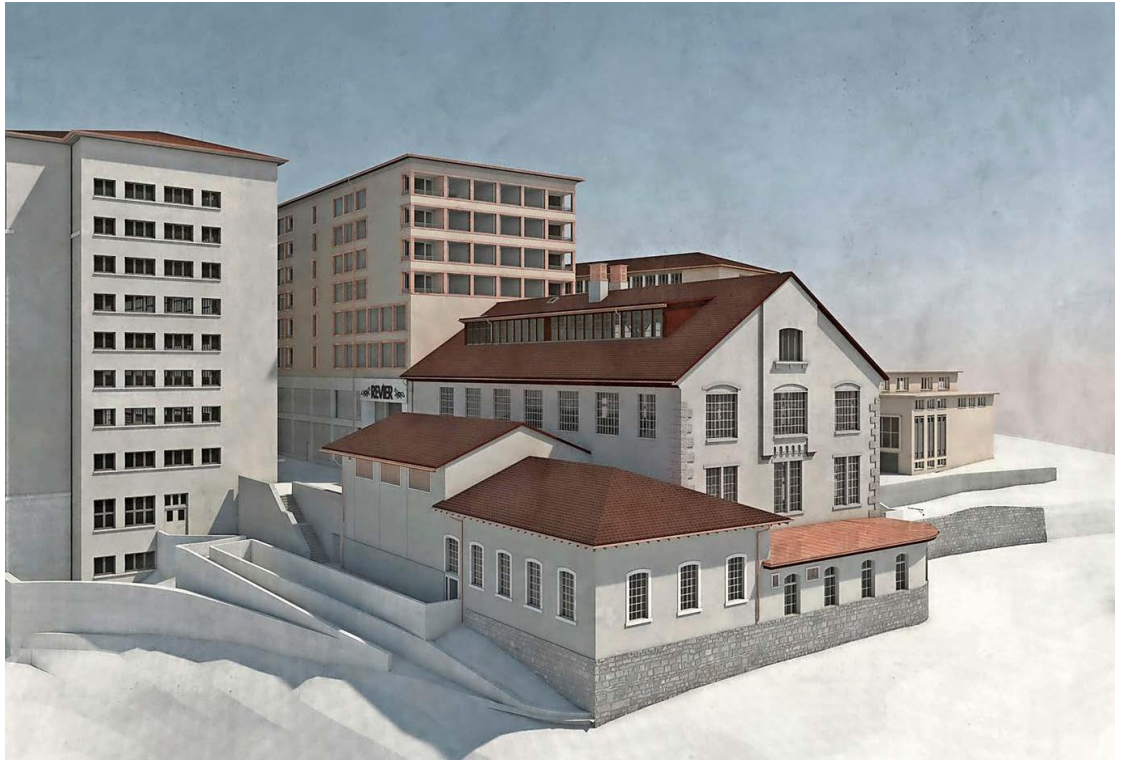
Das Rheinflallhotel wird ein Mix aus alter Industrie- baute und Neubau.

Doch nicht nur architektonisch hat sich das Projekt in den letzten Jahren verändert: Einst angedachte Räume für Gewerbetreibende, geplante Ateliers