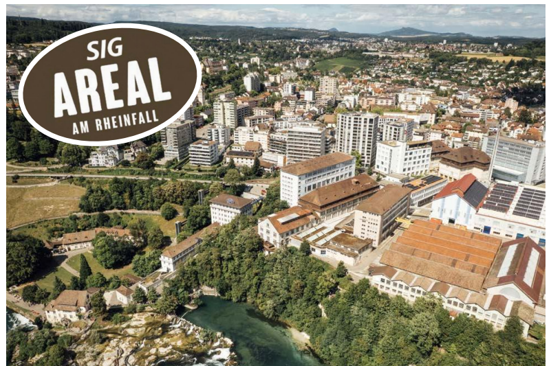
Das SIG Areal am Rheinfall besticht nicht zuletzt durch seine einzigartige Lage.

Die grösste Frage, die sich einem stellt, wenn man das Gebäude verlässt: Welcher Raum gefällt am besten? Hell, freundlich, modern, warm und chic (besser: industrial chic) sind sie alle. In einem Wort: «Wow» eben.